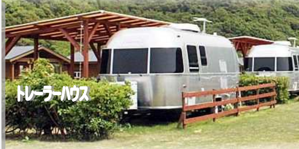
トレーラーハウス

淡路の人でも南の方の人じゃないと知らない人がいるんじゃないでしょうか？ 福良公民館を左折してプラザ淡路島の方へ。山の上から海を見渡す絶景を楽しんでいるとメインの道から細い道への看板に沿って急な坂道をどんどん下って突き当たると淡路じゃのひれオートキャンプ場があります。