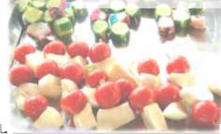
焼きあがる前の一品

いよいよBBQのシーズンがやってきました! BBQの醍醐味は、楽しい仲間とのコミュニケーション。そこでBBQで楽しいコミュニケーションをとるための心得をご紹介します。