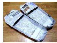
新聞紙を利用したスリッパ