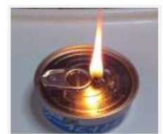
ツナ缶を利用したランプ