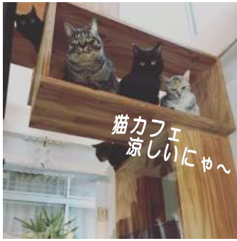
猫カフェ 涼しいにゃ〜