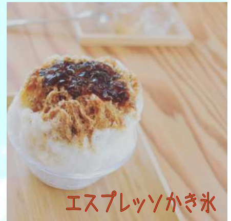
エスプレッソかき氷

夏のひんやりは、冷たいかき氷が最高ですね〜。実は、淡路島唯一の猫カフェ“toneko”で、地元産のフルーツ（苺、桃、イチジク、夏ミカンetc.）を使ったかき氷やドリンクを味わうことができます。ほかに、スペシャルティーコーヒーやリピートNo.1のフレンチトースト、地元産粘原米の米粉を使ったケーキ等、淡路島の食材や旬の果物を使った季節限定のメニューを楽しむことができます。