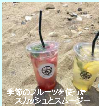
季節のフルーツを使ったスカッシュとスムージー

淡路島の最北端、岩屋ポーターミナル・ジェノバライン乗り場から西へ徒歩5分、岩屋のレトロな商店街、甘く磯の香りがする茶間川(岩屋の中心に流れる川)のほど近くに、淡いブルーの外観の岩屋珈琲店はあります。