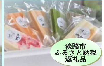
淡路市ふるさと納税返礼品