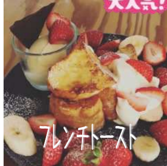
フレンチトースト