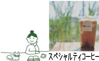
スペシャルティーコーヒー