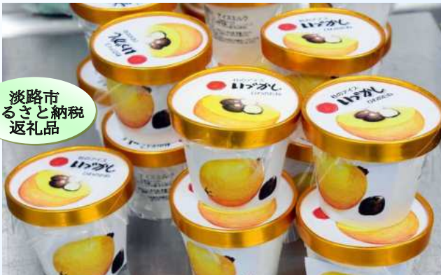
淡路市ふるさと納税返礼品

神戸淡路鳴門自動車道仁井バス停下車、常隆寺山を目指してカーブ道を登って行くと、いづかしの杜(旧仁井保育所)があります。