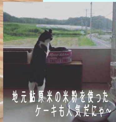
地元産粘原米の米粉を使った ケーキも人気だにゃ〜