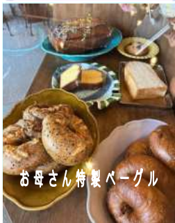
お母さん特製ベーグル