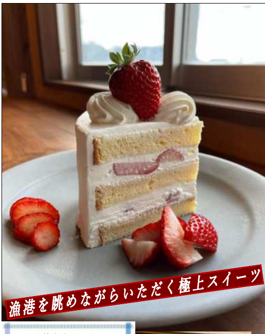
漁港を眺めながらいただく極上スイーツ