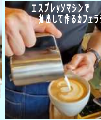
エスプレッソマシンで抽出して作るカフェラテ