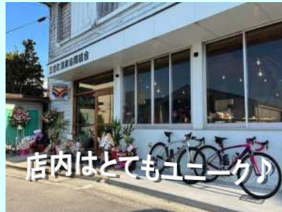
店内はとてもユニーク

淡路島の西海岸では、ロケーションを楽しみながら飲食できる店が随分増えてきました。今年1月には、洲本市五色町都志漁港前にも“大六珈琲”がオープンし注目されています。店の前に広がる瀬戸内海や漁港に停泊している船、そこに夕陽が重なると最高のインスタ映えスポットに。建物は五色町漁業協同組合の事務所をリノベーションし、店内は海が一望できる窓際のカウンター席や、秘密基地のような遊び心あふれる中二階席などユニークな空間が広がります。