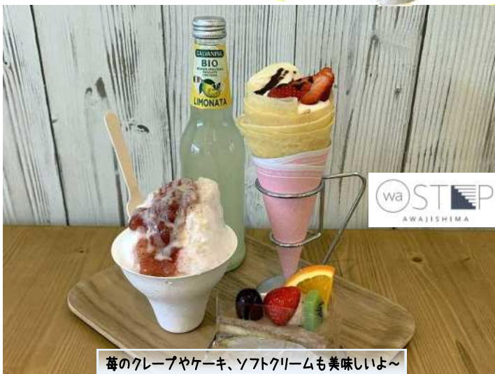
苺のクレープやケーキ、ソフトクリームも美味しいよ～

ケーキ・クレープ・ソフトクリーム・・・夏はやっぱりかき氷。自家製の苺ジャムをたっぷり氷にかけ、さあどうぞと目の前へ。一口食べてみると、苺が躍っているようでした。人工甘味料などは一切使っておらず苺本来の味わいを楽しんでいただけます。あまり甘くなくて氷がほんわかと温かく感じます。味、私たちが家で作る苺ジャムのような自然の味です。また、ソフトクリームも島内の牛乳を使用して、あっさり。口の中でのいやみ甘さが残らずスッキリしたな後味でした。淡路島なんとオレンジも好評でケーキにも使用しますが収穫が6月迄なのでジャムでどうぞとの事です。また、4月に旧津名町で星の果実園の姉妹店が開店しています。ここの推しはジェラートです。小さな町で冷たいかき氷をいただきながら、小休憩はいかがですか？（応援隊：岡 まさよ）