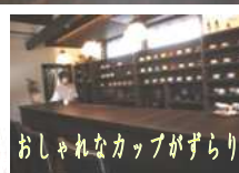
おしゃれなカップがずらり