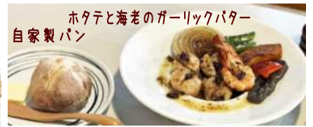
ホタテと海老のガーリックバター 自家製パン

南あわじ市福良甲1291-5 TEL 0799-52-3609 定休日 水曜日 営業時間 11:30~13:30 17:00~20:30