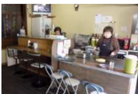
店内には、鉄板前席とカウンター席、テーブル席があります。