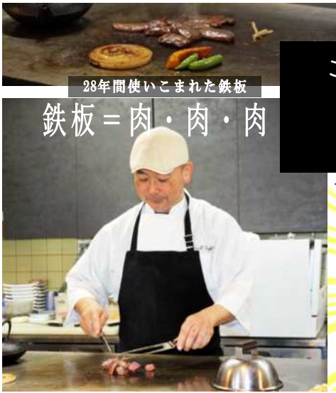
28年間使いこまれた鉄板