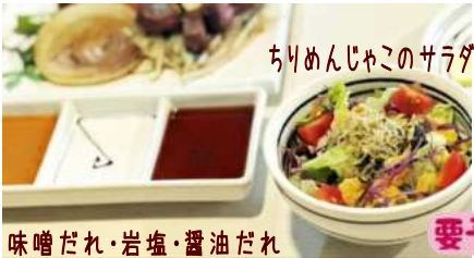
ちりめんじゃこのサラダ