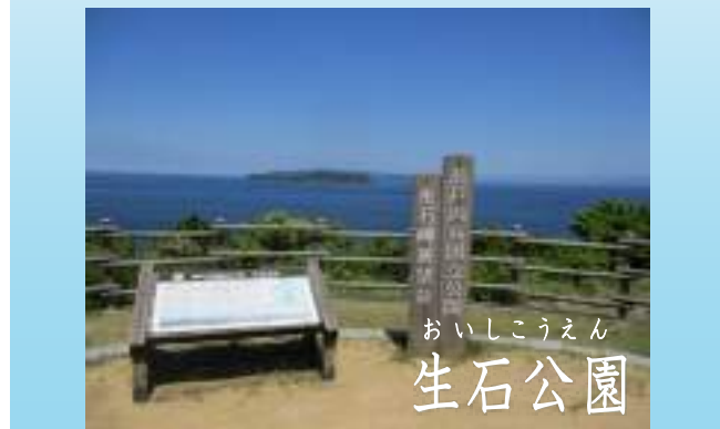
おいしこうえん 生石公園

まず初めに紹介するのは、三熊山の「洲本城跡」から見る景色です。ここへは何回となく行っていますが、どの季節に行ってもいいなと思います。車で行っても大浜公園から歩いて行っても気軽に行け、天守台跡から見る大浜公園や市街地、紀淡海峡方面の景色は最高で、生まれ育ったふるさとも感じます。