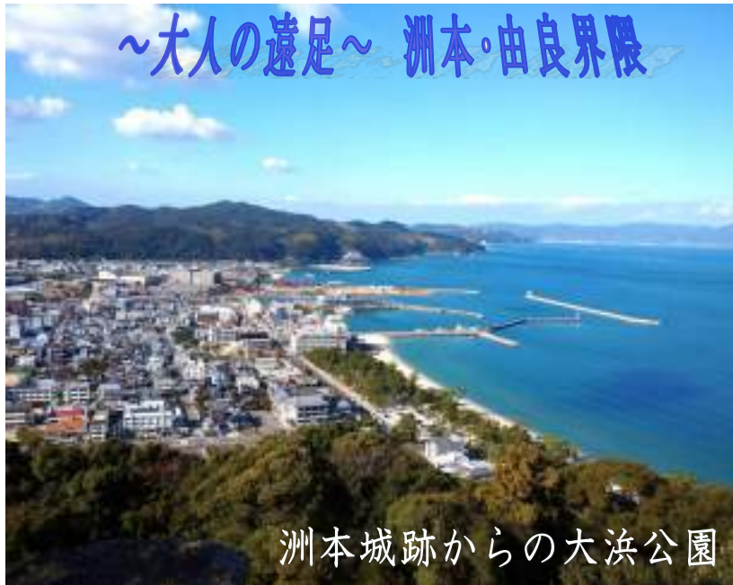
洲本城跡からの大浜公園

洲本市には景色のよいところがたくさんありますが、私の「お気に入り」のニヶ所を紹介したいと思います。このニヶ所ともご存知の人も多いとは思いますが、季節のいい時にぜひ訪れてみてくださいね。