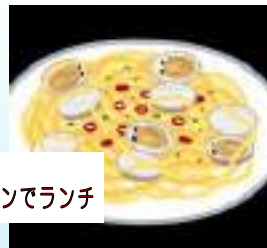
予約必須のイタリアンでランチ

淡路北部にファンが多い「くるみや」さん。淡路にケーキ屋さんがあった時からあるお店