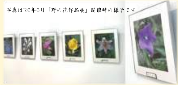
写真はR6年6月「野の花作品展」開催時の様子です

池の上に佇む美術展示室と県民ギャラリーでは、1年を通して様々な美術展示企画を開催します。2025年美術展示年間カレンダーは淡路文化会館のホームページをご確認ください。