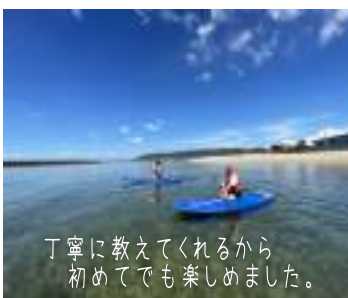
丁寧に教えてくれるから初めてでも楽しめました。

1人でスタンダードSUP 友だちや家族でメガSUP (レクチャー) + (体験) = 約90分