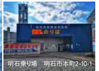
明石乗り場 明石市本町2-10-1