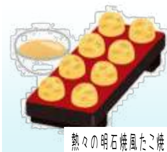
熱々の明石焼風たこ焼き