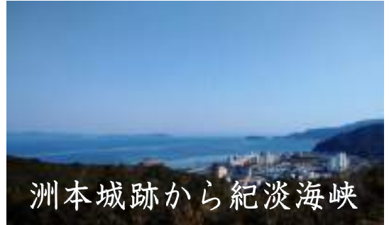
洲本城跡から紀淡海峡