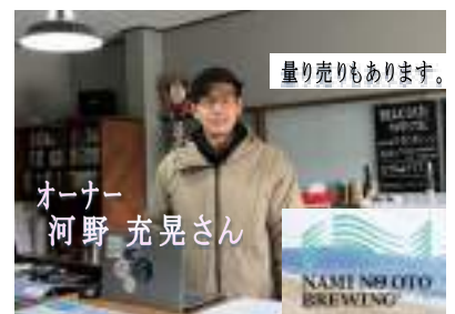
量り売りもあります。