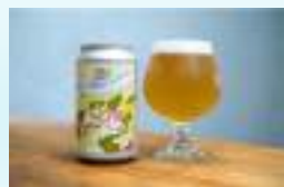
なんとオレンジベルジャンホワイト