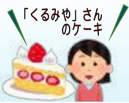
「くるみや」さんのケーキ

淡路北部にファンが多い「くるみや」さん。淡路にケーキ屋さんがあった時からあるお店