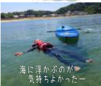
海に浮かぶのが気持ちよかったー

最後に海に入ったのは小学6年生の夏。淡路島民でありながらも、海は身近にありすぎて特別感はありませんでした。そんな中、新しい海の楽しみ方を探して江井の町を歩いていると「イザナギSUP」を発見。場所は江井海水浴場のすぐ前。人が少なく静かで、海の透明度が高く水深も浅いなど、さまざまな理由から江井海水浴場を体験場所として選んだそうです。