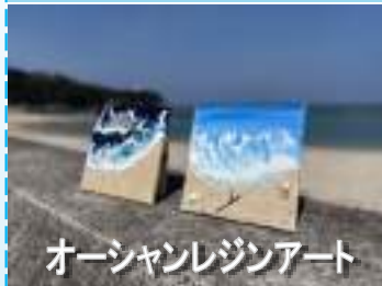
オーシャンレジニアート