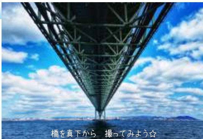
橋を真下から 撮ってみよう☆