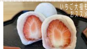
いちご大福も おススメ