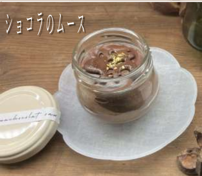
ショコラのムース