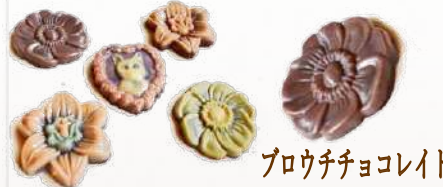
ブラウチチョコレート