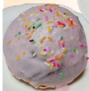
ストロベリーチョコ