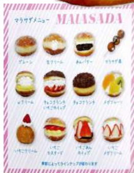
映える可愛いドーナツ