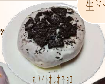
ホワイトオレオチョコ