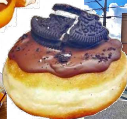
マラサダドーナツ テイクアウト専門店