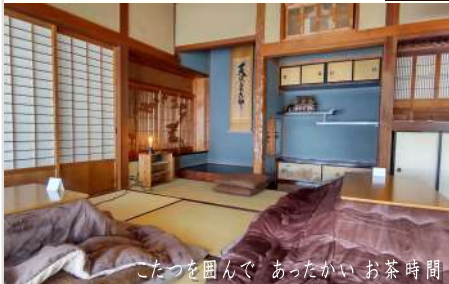
こたつを囲んで あったかいお茶時間

【こたつ】『柴會』の嬉しい特徴の一つが、畳の部屋に並ぶこたつ。寒い時期には最高のおもてなしです。こたつで暖をとりながら温かいお茶をいただくと、心も体も温まり自然と会話も弾みます。