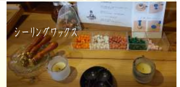
シーリングワックス