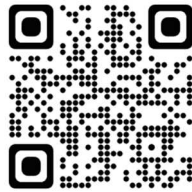
兵庫県公共施設予約システム